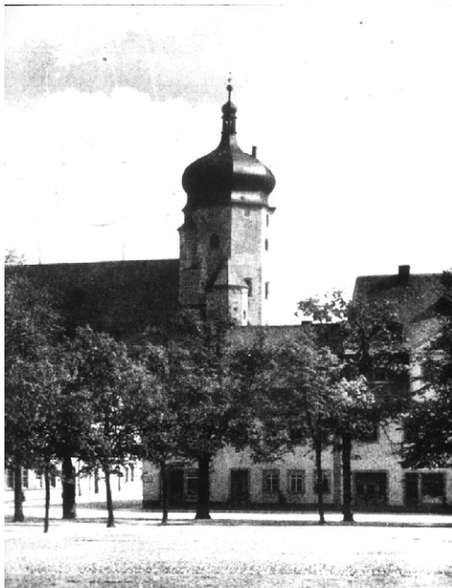
Abb. 2 Marienberger Stadtkirche, vom Marktplatz gesehen

... 100 Jahren „Paulus“-Oratorium in der Kirche St. Marien