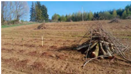
Schaffung von Ausgleichshabitaten