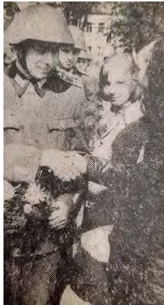
Pioniere überreichen den vereidigten jungen Soldaten Blumen und kleine Geschenke, 1974